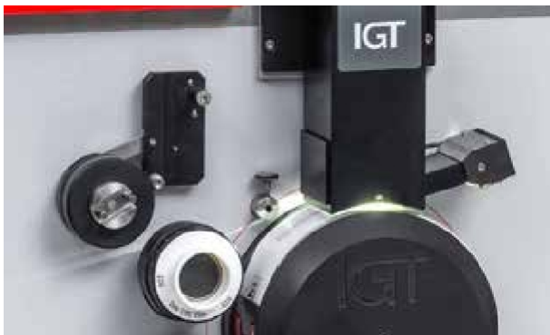
IGT Pick ISO 3783: Die Kamera führt einen Scan durch.

Die umfangreichen, automatisierten Testmethoden verhindern Fehler und Abweichungen seitens des Benutzers. Die Ergebnisse werden somit minimiert. Dadurch ist das Testergebnis weniger vom Bediener abhängig. Mit „Next Level“ möchte IGT Testing Systems die Voreingenommenheit des Bedieners bei der Bewertung der Ergebnisse eliminieren. Für mehrere Testmethoden wurden Algorithmen entwickelt, um das Testergebnis auszuwerten. Es ist kein Lineal mehr erforderlich, um die Länge des Tintenflecks beim Druckpenetrationstest zu messen; die Länge wird einfach direkt nach dem Drucken bestimmt.