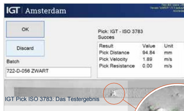
IGT Pick ISO 3783: Das Testergebnis