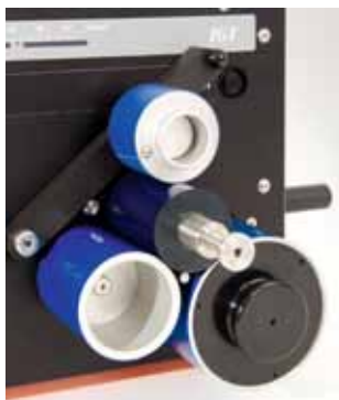
プリンティングディスクへの着肉

試験機の手前側に付いているプッシュボタンを使用して印圧をかけます。オレンジブルーファ 70では、様々な幅のプリンティングディスクを使用できます。この装置は特に、クレジットカード或いは最大印刷幅70mmの試験サンプル等に直接印刷するために設計されています。定期的に幅広印刷が必要な場合、ベストチョイスはオレンジブルーファ70です。