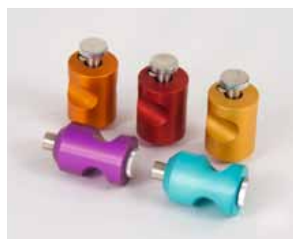
IGT 固定容量インキピペット