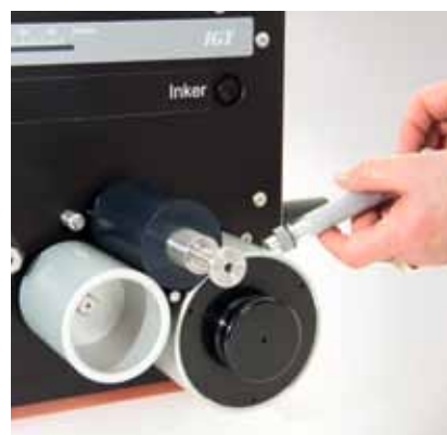
IGTインキピペットでインキを供給